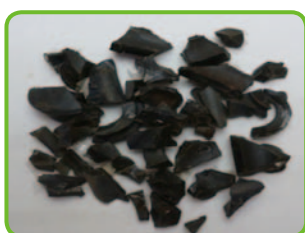
実際に見つかったゴムの混入物

製造過程でゴムは比重が塩ビと近く金属探知機にも反応しないため、除去が困難です。排出物に、 ゴム等が混入することの無いよう、周知徹底をお願いいたします。